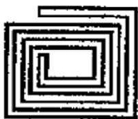
Figura 2. Ejemplo extremo final

Para cerrar la sesión el formador propone un ejemplo extremo (Figura 2) a lo que los EPM acuerdan, sin que se observe desacuerdo, que es polígono y el espacio central forma parte del exterior del polígono (KoT3).