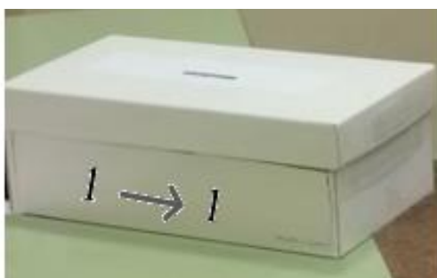
Figura 1. Máquina recibida

En la segunda sesión de la actividad se analizó la situación de aprendizaje vivida, identificando tanto los aprendizajes adquiridos como la gestión de ese proceso de aprendizaje. Finalizada la actividad se